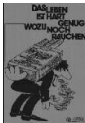
Flugblatt orange, DIN A/4, D/50, 0,30 Euro.

Achtung! Wir müssen die Lager räumen und bieten für Schulen und Interessierte jede Menge Material zu Sonderpreisen an! Telefon 0664/9302958. www.alpha2000.at/nichtraucher