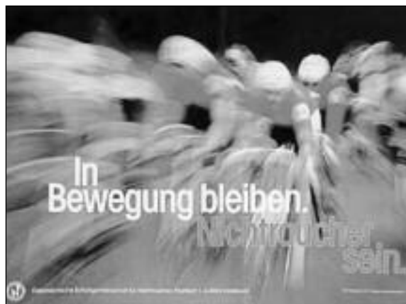
„In Bewegung bleiben. Nichtraucher sein.“ Farbposter DIN A 2 (59 x 42 cm), Best.-Nr. P/36, 2,20 €