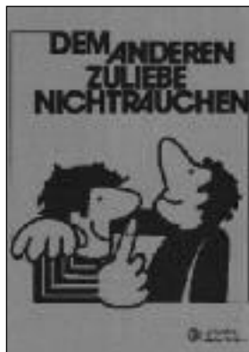
Flugblatt grün, DIN A/4, D/51, 0,30 Euro.

(RoRo) Wir fordern schon lange ein österreichweites einheitliches Rauchverbot an Spielplätzen, einschließlich E-Zigaretten. Der Grund ist wohl für jeden einleuchtend: Kinder wollen spielen und sollen vor Tabakrauch und Zigarettenkippen geschützt werden. Unverständlich, dass es beim heutigen Wissen über die Schädlichkeit des Rauchens überhaupt noch Eltern gibt, die neben ihren Kindern rauchen!